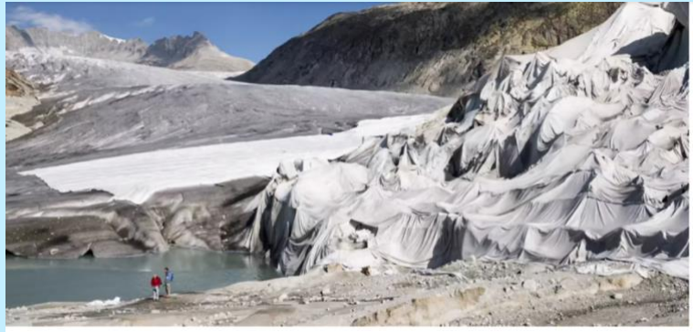
Der Rhonegletscher wird von weissen Decken geschützt.