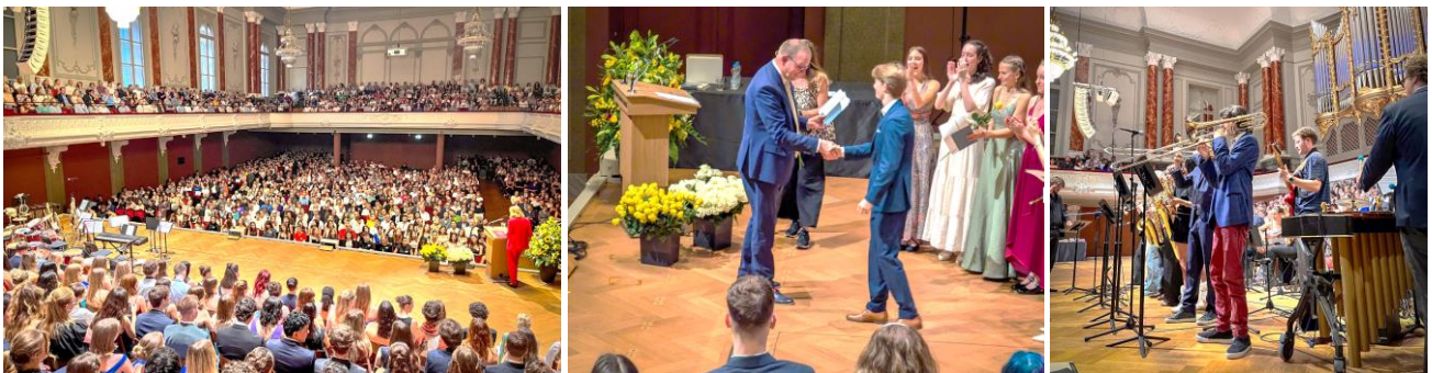
Die Maturafeier im Stadtcasino mit dem GM-Maturjahrgang 2024

Im August 2024 konnte das Gymnasium am Münsterplatz erneut sieben neue 1. Klassen aufnehmen. 612 Schülerinnen und Schüler besuchen derzeit das GM und werden von 94 Lehrpersonen mehrheitlich in Teilpensen unterrichtet. Jugendliche mit 54 Nationalitäten, 462 Mädchen und 150 Knaben, bereichern unser Gymnasium und beleben den Münsterhügel. Von den 153 Jugendlichen, die sich im Jahr 2024 am GM den Maturaprüfungen gestellt haben, bestanden 151. Die traditionelle Feier des Gymnasiums am Münsterplatz zur Matura und zum Schuljahresende mit allen GM-Klassen, den Lehrpersonen und den Angehörigen fand am Freitag, 28. Juni 2024 im schönen Stadtcasino Basel statt. Als Festrednerin durften wir Regierungsrätin Esther Keller begrüßen.