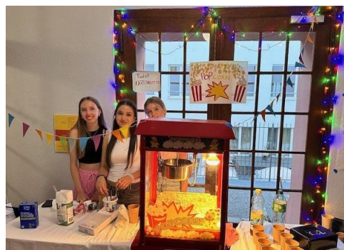
Impressionen GM-Fest 30. August 2024