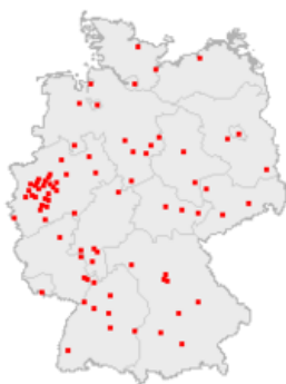
Abb. 1: Lage der Großstädte Deutschlands (Quelle: Petersson, 2002, 3).