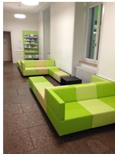
Leselounge beim Lernzentrum