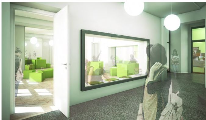
Das neue GM-Lernzentrum

Wer sich für den ‚normalen Zug‘ ab 3. Gymnasialjahr anmeldet, erhält Zugang zu attraktiven neuen Bildungsangeboten, welche das GM im Rahmen der neuen vierjährigen Gymnasialaufbahn (10.-13. Schuljahr) in seinen ‚normalen‘ Klassen aufbaut. Neben spannenden neuen Bildungsangeboten wie ‚politischer Bildung‘ und motivierenden zusätzlichen Studienreisewochen im Ausland bietet das GM im normalen Zug der 3. Klassen ab August 2017 die Wahloption neuer GM-Coachingklassen , in welchen die Schülerinnen und Schüler des GM durch ihre GM-Fachlehrpersonen bei der Bewältigung ihrer Hausaufgaben gezielt unterstützt werden. Der Hintergrund für dieses neue Angebot des GM ist, dass viele Schülerinnen und Schüler der gymnasialen Oberstufe erfahrungsgemäss Mühe damit bekunden, zuhause ohne fachliche Hilfe wöchentlich die Hausaufgaben zu bewältigen. Auch die sinnvolle Einteilung der eigenen Zeitressourcen ist für viele eine Herausforderung.