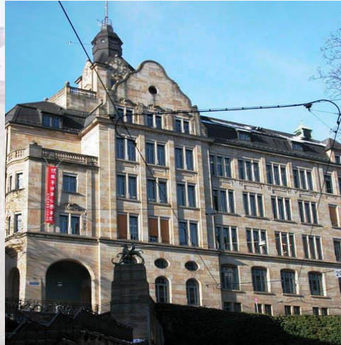
Gym. Leonhard EG 018