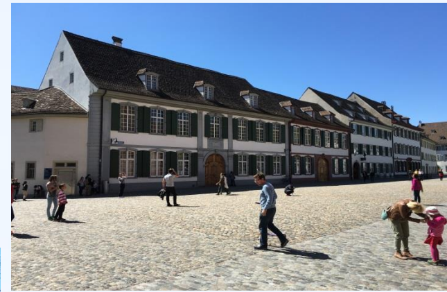
Gym. Münsterplatz EG 022