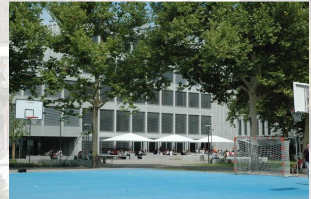
Gym. Bäumlihof EG 024