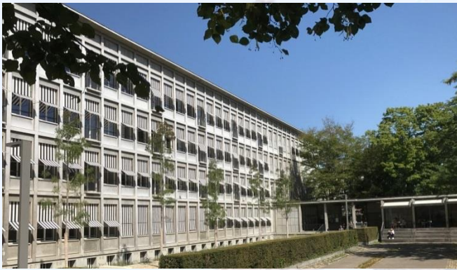
Gym. Kirschgarten Aula