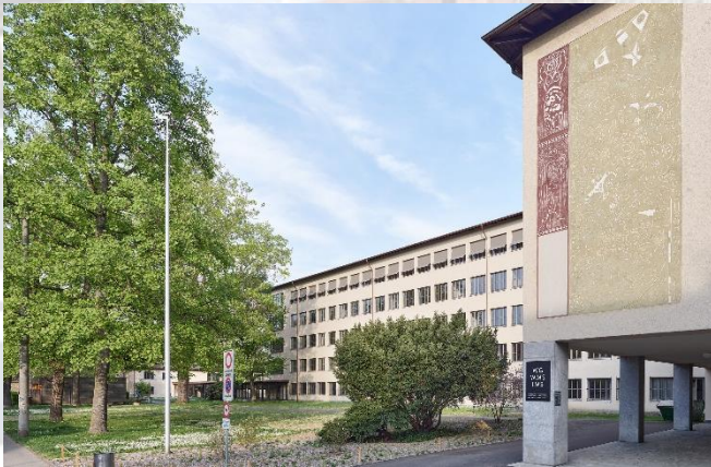
Wirtschaftsgymnasium EG 026